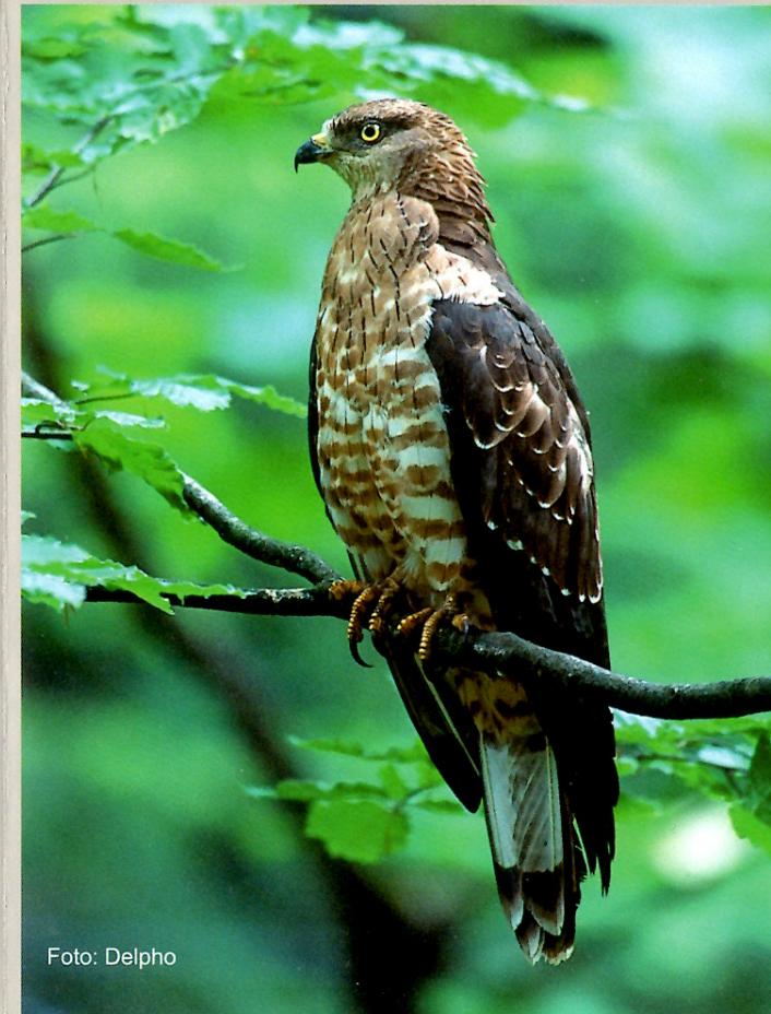
Wespenbussard, Pernis apivorus