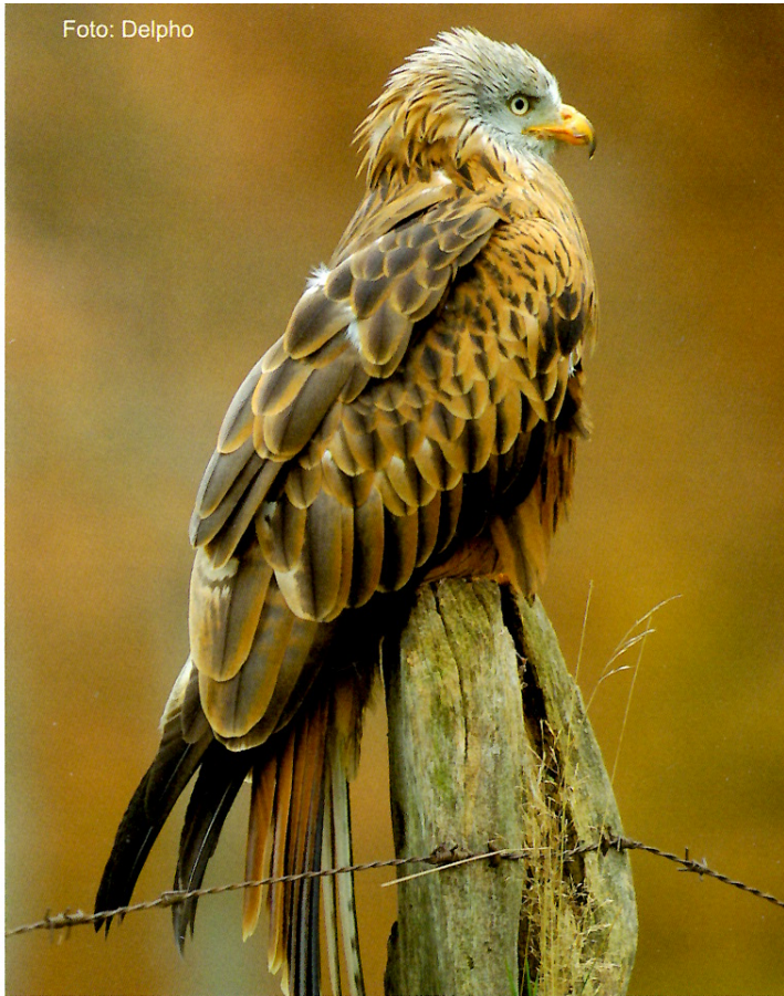
Rotmilan Milvus milvus